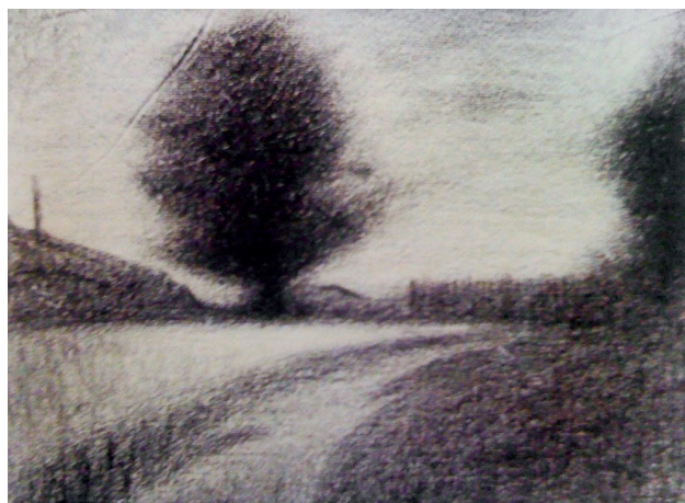
▲作品注释：以上两副为法国点彩派和构图大师修拉的素描稿，营造出一种诗意的境界。