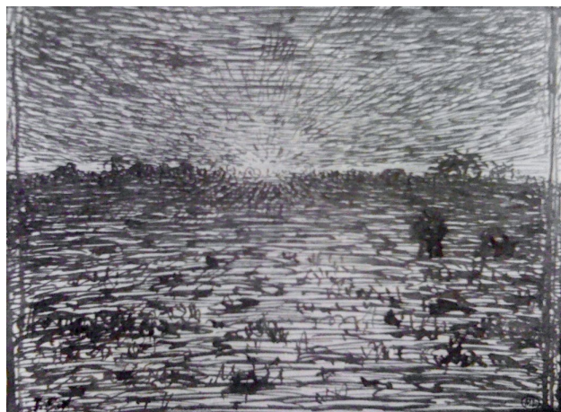
▲作品注释：法国画家米勒的作品，直接通过构图表达着一种纯朴和自然的情感。